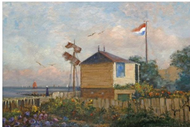
Mit atelier – Betzy Rezora Akersloot-Berg

Het atelier zou een prachtige aanvulling zijn op het historische, culturele verhaal dat in en om het museum wordt verteld. Betzy Akersloot-Berg heeft het oorspronkelijke gebouw uit Noorwegen laten komen. Ze heeft het ook zelf op schildersdoek vastgelegd. Later is het verbouwd tot het huidige gebouw: begane grond in baksteen, bovenbouw hout. Betzy gebruikte het gebouw om te schilderen. Ze noemde het schilderij ervan 'mit atelier': 'mijn atelier'. Alleen het schilderij is al een historisch tafereel; er is geen hoge dijk zichtbaar, we zien schepen met zeilen op de achtergrond en er staat een mast met rafelige zeilen vlak achter de dijk.